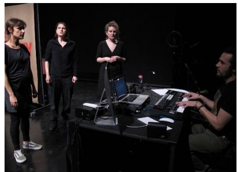
Photo de répétition/recherche création sonore